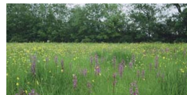
Prairie de fauche