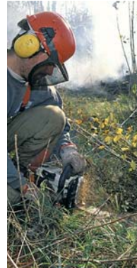
Débroussaillage de prairie

Débuté en 1993 et mis en œuvre par des associations (Conservatoires d'espaces naturels, WWF et LPO), le programme Loire nature a pour objectif la préservation des sites naturels et de la biodiversité de la Loire et de ses affluents sur de nombreux secteurs remarquables du bassin. Le maintien des espaces ouverts représente une part importante du travail de terrain. Pour cela, les associations développent de nombreux partenariats avec les agriculteurs. Ainsi, la restauration du pâturage ou le retardement des dates de fauche sont favorisés. Et sur des prairies déjà trop boisées, en cours de fermeture, des actions de débroussaillage sont développées avec des entreprises ou associations d'insertion.