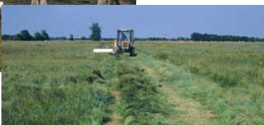
Fauchage sur site de nidification