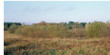
En l'absence de pâturage, les prairies se ferment et se transforment en forêt