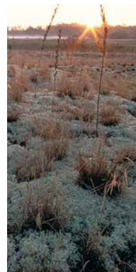
Pelouse sèche sur sable

La végétation luxuriante des prairies de fauche évolue, si elle n'est pas suffisamment entretenue, vers la saulaie ou la roselière. Les prairies pâturées offrent une végétation plus haute dont la diversité dépend de la densité et du type d'animaux qui les entretiennent. Les pelouses, occupent des sols moins fertiles où la végétation peine à se développer. Si l'entretien peut-être assuré par pâturage ovin, il n'est cependant pas toujours nécessaire.