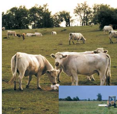
Des bovins pour l'entretien du site

En Saône et Loire, le Conservatoire des sites naturels Bourguignon préserve 73 ha de prairies naturelles de Loire où un agriculteur biologique s'est installé. L'acquisition de ces terrains s'est faite en partenariat avec le SIVOM « La Sologne bourbonnaise » qui souhaitait y installer de nouveaux puits de captage. La mise en place sur le site d'un pâturage de vaches Charolaises aide à la préservation et au maintien des prairies naturelles, lesquelles permettent d'avoir une eau de bonne qualité protégée des pollutions ponctuelles.