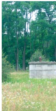
Puit de captage