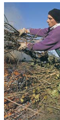
Chantier de bénévoles

Certaines prairies sont depuis trop longtemps laissées à l'abandon et les arbustes sont trop gros et trop abondants pour que la mise en pâturage et la dynamique naturelle des rivières permettent d'éviter la fermeture des milieux. Des actions de débroussaillage sont alors mises en place avec l'aide des entreprises de réinsertion ou grâce à des chantiers de bénévoles. Si vous souhaitez participer à l'un de ces chantiers contactez la LPO ou le Conservatoire d'espaces naturels de votre région. Vous pouvez aussi trouver des propositions sur le site www.loirenature.org