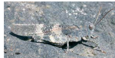
L'Oedipode turquoise est un criquet caractéristique des pelouses sèches

En bord de rivière, le pâturage par les animaux domestiques permet de limiter l'envahissement des rives par la végétation arbustive. Aussi, ce mode d'exploitation s'adapte bien aux aléas de l'érosion et de l'inondation. D'autre part, le maintien des prairies favorise la présence de nombreuses espèces de plantes et d'animaux sauvages rares et menacés.