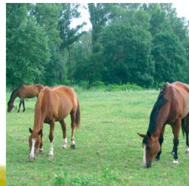
Pâturage équin sur les bords de l'Allier

Elevage extensif et protection de l'environnement : une alliance toute naturelle sur les bords des rivières.