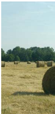
Les prairies de fauche produisent un foin de qualité

sont également présents sur ces prairies et permettent de produire un miel de qualité.