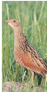
Le Rôle des genêts

Les prairies des basses vallées angevines constituent le principal site de reproduction du Rôle des genêts (plus de 30 % de la population nationale). La Ligue pour la Protection des Oiseaux Anjou travaille avec les agriculteurs pour développer des mesures respectueuses de l'environnement et expérimenter de nouveaux modes de fauche (fauches tardives, bandes refuges...) afin d'éviter la destruction des nids. Ce travail s'est traduit par la création d'une marque "L'Éleveur et l'Oiseau", destinée à mieux commercialiser la viande bovine produite sur le site.