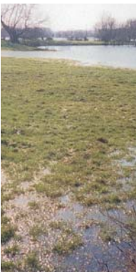
Le réseau racinaire de la végétation filtre les eaux