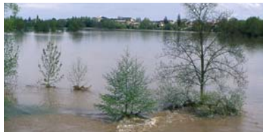
Les prairies, des zones d'expansion pour les crues

Les prairies et pelouses, comme les forêts, agissent comme des stations d'épuration naturelles. La végétation filtre l'eau répandue par la crue et absorbe une partie des engrais et pollutions diverses avant que l'eau ne retourne à la rivière ou atteigne la nappe phréatique. En période de crue, ces espaces stockent l'eau, atténuant les inondations. Les zones doivent donc rester libres de tout aménagement (habitations, industries, clôtures...) et éviter une végétation trop importante (arbustes, bois morts...) qui risquerait d'être entraînée par les crues et de s'accumuler au niveau des ouvrages d'art.