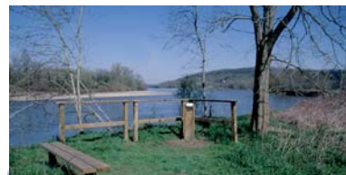
Sentier de découverte

À la confluence de la Loire et de l'Allier, la mise en place d'enrochements était envisagée pour préserver 12 ha de cultures de la dynamique naturelle de l'Allier et de l'érosion des berges. Pour éviter cette opération néfaste à la rivière et à la biodiversité, le Conseil général de la Nièvre a racheté ces terrains et transformé la culture de maïs en prairie naturelle, en partenariat avec le WWF. Le site est maintenant exploité par un élevage extensif de bovins charolais et un sentier de découverte en bord d'Allier longe une partie de la prairie.